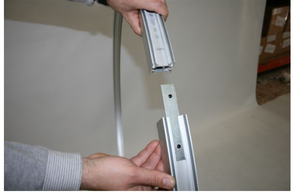
Colocar las uniones