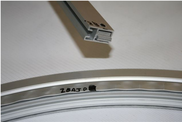
La pinza debe estar siempre cerrada