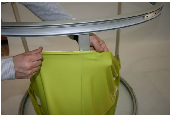
Coincidir la costura en la costilla