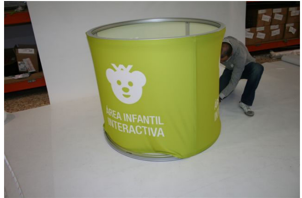
Un poco por abajo