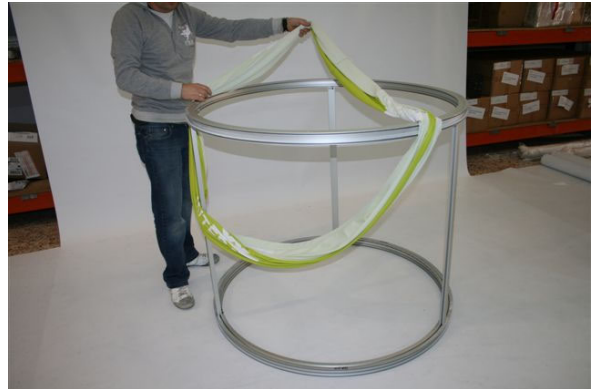
La tela se pasa por arriba