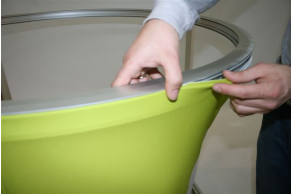
Ir colocando la tela sin estirar nada