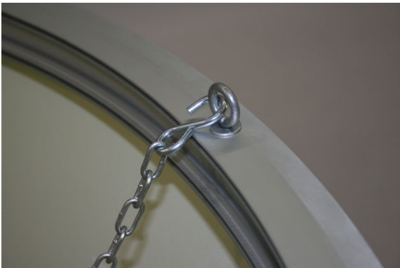
Colocar los canchamos