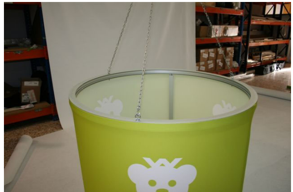
Lista para colgar