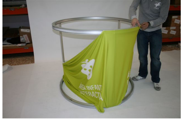
Colocando la tela