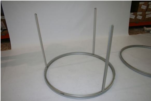
Colocar las tres costillas y la parte de arriba