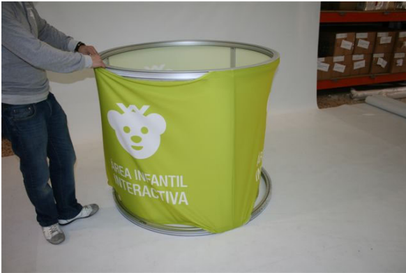
Un poco por arriba