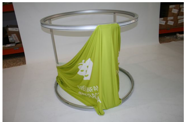
Primero arriba y luego abajo